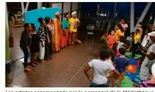
Les artistes accompagnés par le personnel de la Médiathèque à la fin du spectacle.